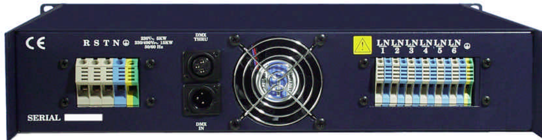
6 Canales x 2,5 Kw.