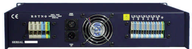
6 Canales x 2,5 Kw.