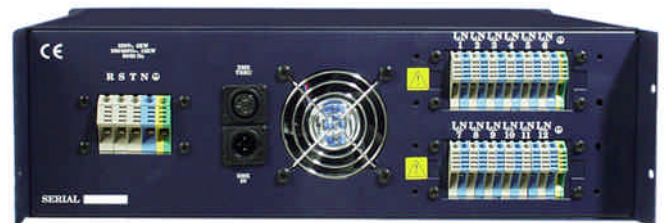
12 Canales x 2,5 Kw.