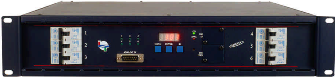
6 Canales x 2,5 Kw.