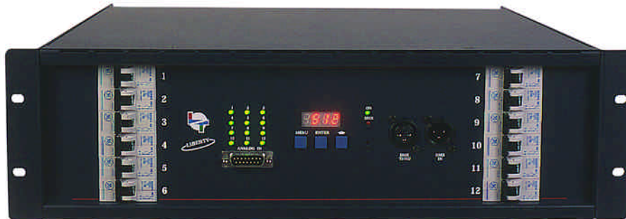
12 Canales x 2,5 Kw.