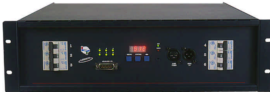
6 Canales x 5 Kw.